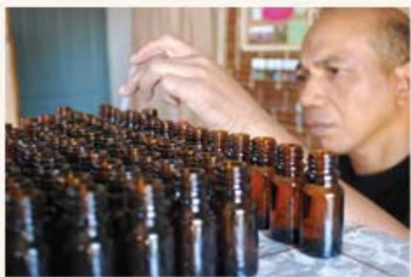
Mise en flacon

D'autre part, un suivi plus technique a été mis en place afin d'étudier les rendements des huiles essentielles. Ce travail s'effectue entre tous les membres de la coopérative, ce qui ressert encore davantage les liens entre les membres. Aujourd'hui, la coopérative prend vraiment tout son sens et ses membres en perçoivent véritablement l'intérêt..