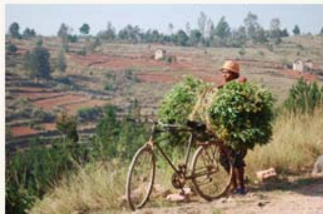
Transport des matières premières

Il est impératif d'assurer une régularité de la production des matières premières afin de pouvoir effectuer des prévisions fiables et pérenniser les relations commerciales entre paysans et distillateurs. Cœur de Forêt a ainsi mis en place des fiches de suivi des zones de cueillette, des parcelles des paysans, etc. afin d'assurer une gestion durable des ressources naturelles qui respecte le cycle de reproduction de la plante.