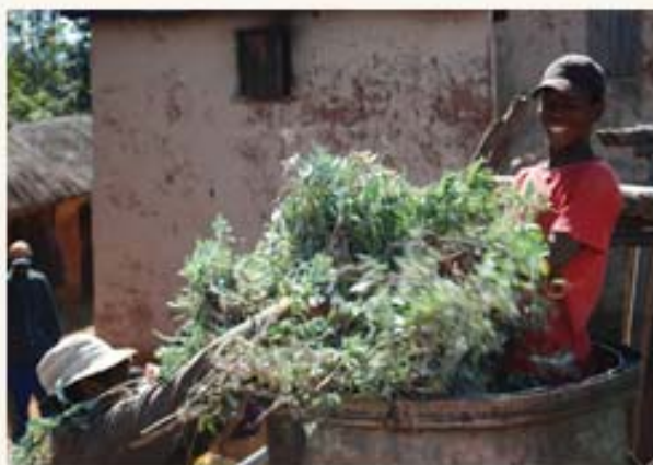
Préparation de la distillation

De plus, certaines huiles essentielles proviennent de la cueillette, il s'agit donc de garantir une cueillette qui ne met pas en danger l'espèce.