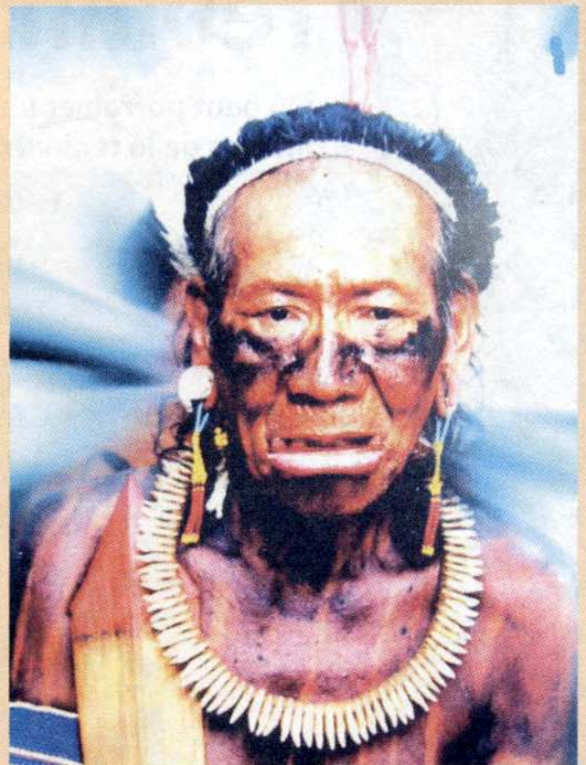
ANDA International, Suisse.

Il est surtout rouge et noir. Les hommes s'appliquent leur peinture à la main. Les enfants sont peints par leur mère. Les femmes, elles, se réunissent tous les 10 jours pour s'inventer de nouveaux motifs.